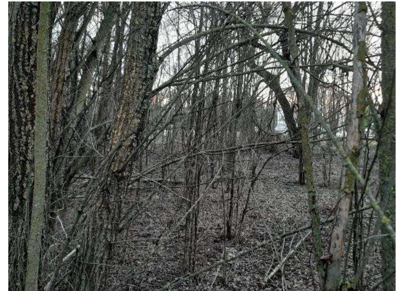
Aspecto actual de la zona central