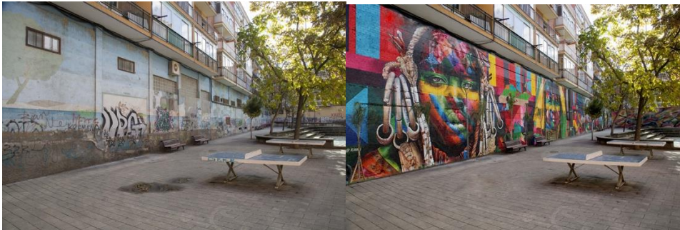
Edificio Calle andarríos