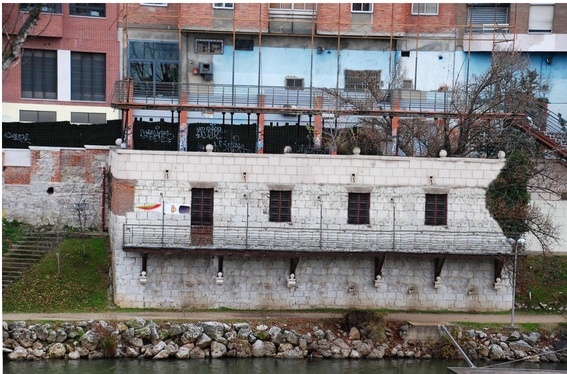
IMAGEN DE CÓMO DEBERÍA ESTAR LA FACHADA DE ESTE EDIFICIO HISTÓRICO.

En segundo lugar, abordar la ampliación del club en la parte superior, donde se realiza habitualmente el botellón y consumo de drogas, gracias a ser una zona sin iluminación y donde el ciudadano por la noche no se atreve a utilizar.